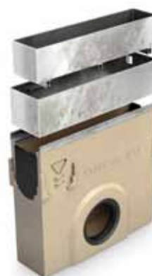
Пескоуловитель с ревизионной рамой

Монтажные узлы под класс нагрузки D400 - по запросу.