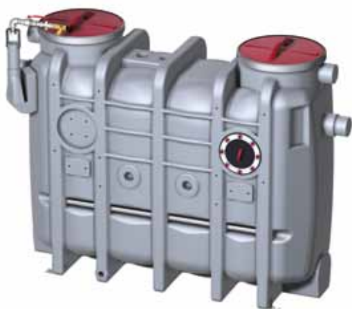
Eco-Jet -O Базовая комплектация* В